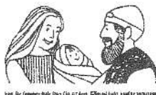
San Giuseppe della Chiesa (1877) - Chiesa degli Angeli e S. Teresa